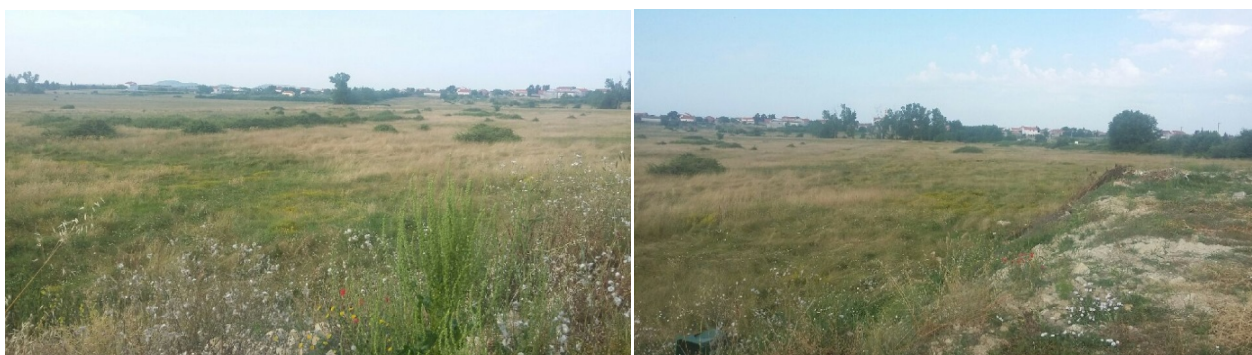
- teren obuhvaćen planom

Naselje Zemunik Donji se nalazi u seizmološkoj zoni od 6 0 MCS, što spominjemo kao opći kriterij, a prilikom projektiranja i izgradnje objekata treba konzultirati Pravilnik o državnom standardu za proučavanje seizmoloških utjecaja na mikrolokaciju.